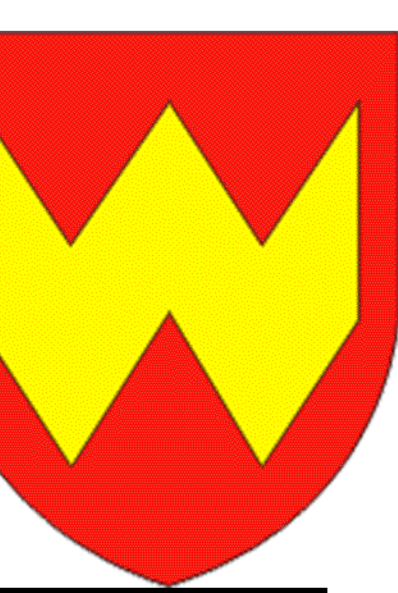
СХЕМА КОМПЛЕКСНОЙ ТЕРРИТОРИАЛЬНОЙ ОРГАНИЗАЦИИ ВОЛОЖИНСКОГО РАЙОНА МОДЕЛЬ ТЕРРИТОРИАЛЬНОЙ ОРГАНИЗАЦИИ

Ивенецкое ПО формируется на базе г.п. Ивенец.