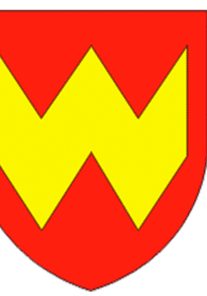
СХЕМА КОМПЛЕКСНОЙ ТЕРРИТОРИАЛЬНОЙ ОРГАНИЗАЦИИ ВОЛОЖИНСКОГО РАЙОНА ОЦЕНКА ДЕМОГРАФИЧЕСКОЙ СИТУАЦИИ

Наиболее благоприятная демографическая ситуация складывается в населенных пунктах ближайшего окружения города Воложина и вдоль основных планировочных осей района.